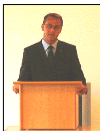
Borgarstjóri ávarpaði gesti

salur sem hægt er að nýta sem þjónustueiningu og félagsaðstöðu.