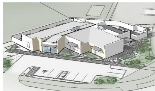
Teikning ASK-arkitekta af Þorláksgeisla

Það er markmið Félagsbústaða að sinna rekstri á þessum húsum af sama metnaði og myndarskap og í öðrum fasteignum félagsins til þess að íbúarnir og þjónustan sem þeim er veitt þrífist þar sem allra best.