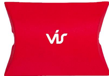
Jólarafhlaðan er komin í hús