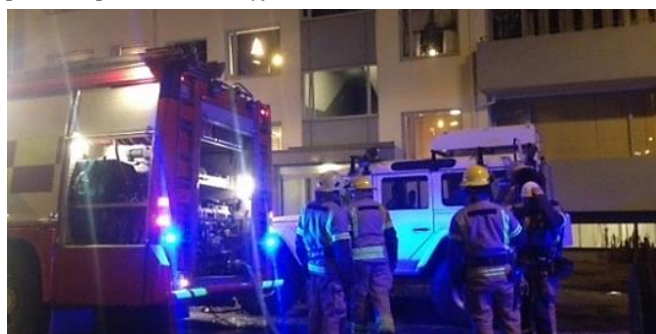
Slökkviliðið að störfum í Hraunbænum.